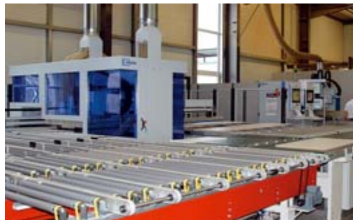
Losgröße 1 in Serie: Die Horatec-Fertigung ist mit modernen Maschinen ausgestattet und logistisch wie organisatorisch beispielhaft optimiert

Lkw zu den Kunden zu fahren. Der mobile Showroom wird dazu bei mehr als 60 Egger-Leithändlern Station machen. Bei 180 Veranstaltungen werden über 2400 Verarbeiter erwartet. In „aufgeklapptem“ Zustand verfügt der vollverglaste Truck über eine Fläche von mehr als 90 m 2 . Ausgestattet mit modernster Medientechnik, lassen