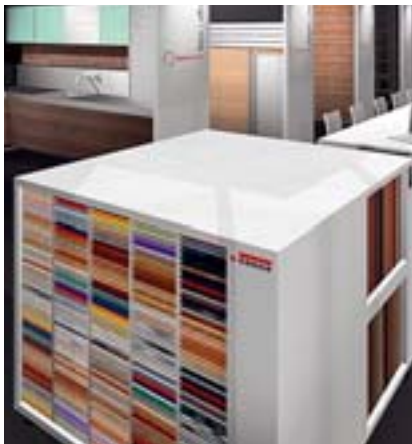
Der Roomdesigner hat unter anderem sämtliche Dekore von Egger an Bord