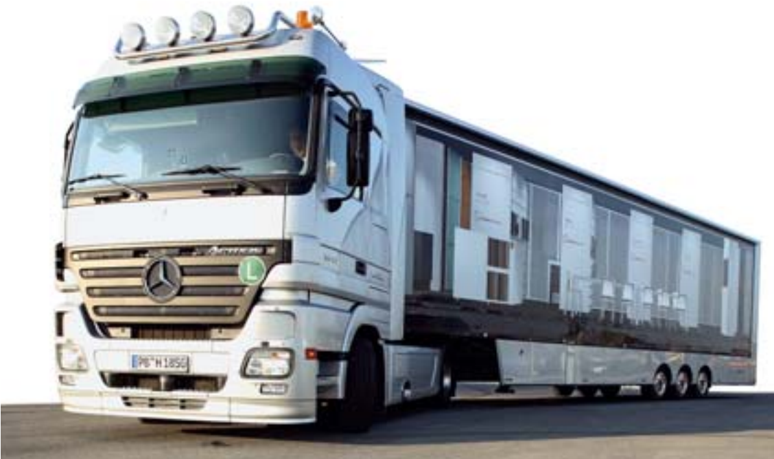
Der mobile Showroom ist seit Anfang August auf Tour durch ganz Deutschland und wird bei mehr als 60 Egger-Leithändlern Station machen. Bei den insgesamt 180 Veranstaltungen werden über 2400 Verarbeiter erwartet