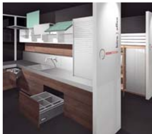
Der Showroom zeigt Einrichtungswelten (Büro, Schlafen, Wohnen, Küche) und Anwendungsmöglichkeiten