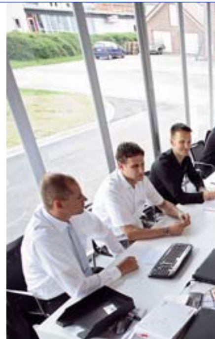
Anwender können im Rahmen der Roadshow an unterschiedlichen Schulungen und Workshops teilnehmen